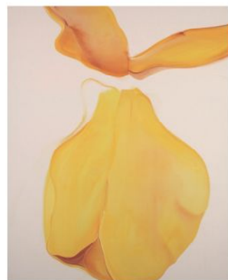
久米 亮子 《flower》2011年作