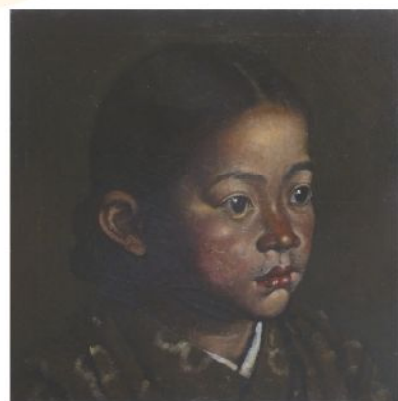
大沢 錠一郎 《童女》1920年作