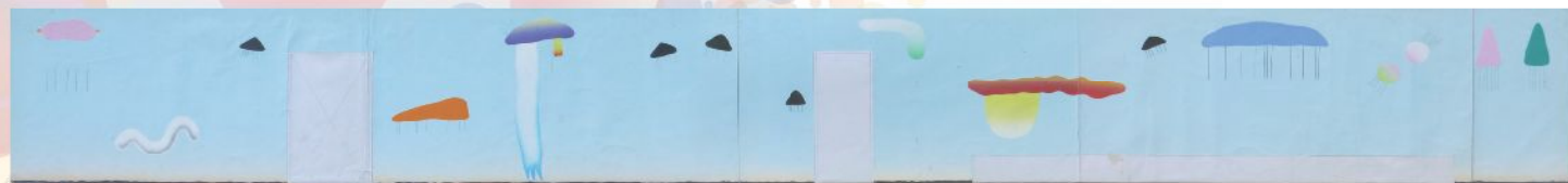
元永定正《東海銀行唐山寮壁画原画》1974年作 26×220cm